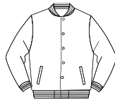
Partes altas complejas