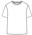
Partes altas sencillas

En nuestro departamento de desarrollos desde cero, nos enfocamos en resolver las necesidades más puntuales en materia de diseño de modas, materiales textiles y avíos, para lograr la creación y desarrollo de prendas premium, en los fits adecuados y con los materiales más cómodos.